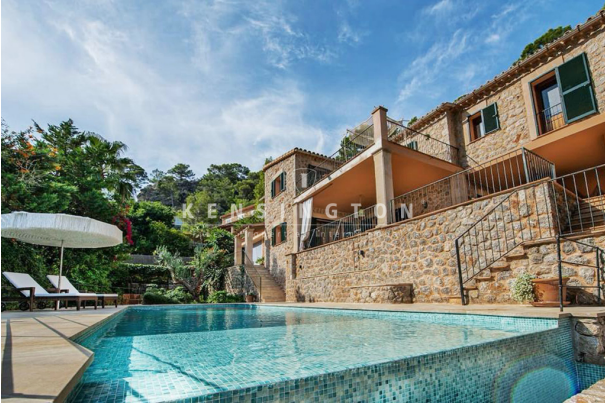
Terrace living room