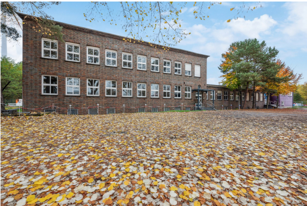
Gebäudeansicht von der Seite