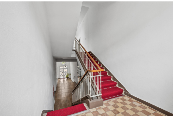
Flur im 1. OG