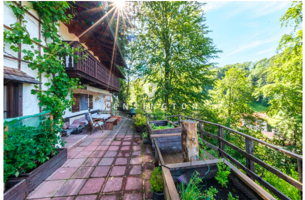
Terrasse mit Blickrichtung zum Berg