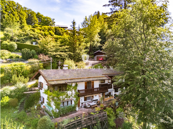
Hausansicht von Süd/West