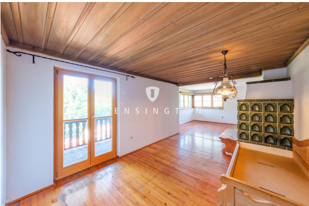
Wohnbereich mit Zugang Balkon