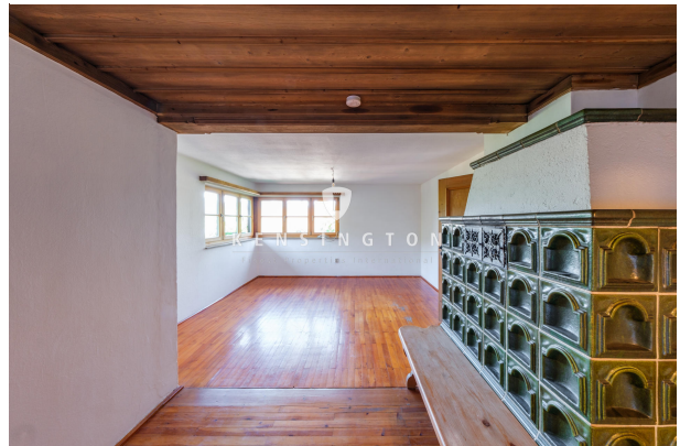
Wohn/Essbereich mit Kachelofen